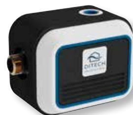
DITECH Anschlussblock Art.-Nr. DT3643

Die DITECH FüllCombi CA dient zur Automatisierung des Füllvorgangs von geschlossenen Systemen.