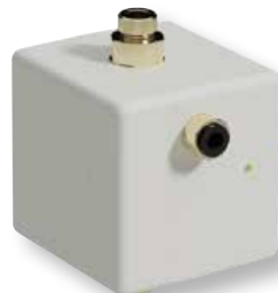
DITECH Hygienespülbox Art.-Nr. DT3638

Die DITECH Hygienespülbox mit integriertem WLAN ist die unkomplizierte und preiswerte Lösung für den bestimmungsgemäßen Betrieb der Trinkwasserinstallation. Die Armatur kann an Waschtischen und -plätzen, Küchenspülen sowie in gewerblichen und kleinen industriellen Anwendungen eingesetzt werden. Sie wird ohne großen Aufwand installiert, überwacht den Installationsbereich und löst dort bedarfsgerechte Spülungen auf Basis der eingestellten Stagnationszeit oder Wassertemperatur aus. Spülvolumen, Temperatur- und Druckmessungen werden protokolliert, sind via DITECH App jederzeit abrufbar und können im html-Format exportiert und auf einen USB-Stick gespeichert werden.