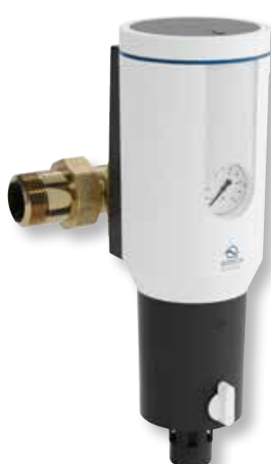
DITECH Rückspülfilter max Art.-Nr. DT3664