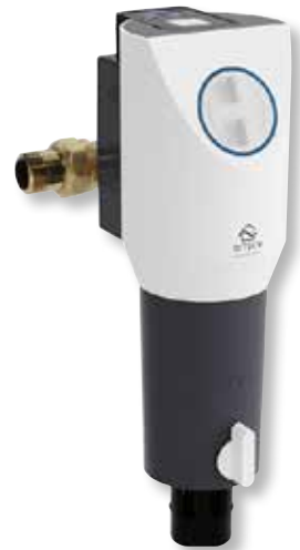
DITECH Rückspülfilter Protect Art.-Nr. DT3676