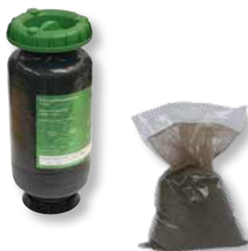
DITECH Kartusche zur Vollentsalzung DT760302, 2,5 Liter DT760304, 4 Liter DT760307, 7 Liter DT760314, 14 Liter

DITECH Austauschgranulat für Enthärtungskartusche DT76072, 2,5 Liter DT76074, 4 Liter DT76077, 7 Liter