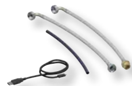
DITECH Anschluss-Set, 2 Boxen Art.-Nr. DT3641