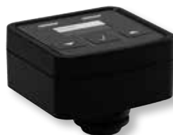
DITECH Digitale Kapazitätskontrolle Art.-Nr. DT3647 für Anschlussmodul Basic