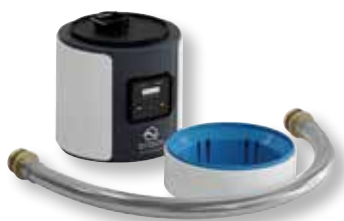
DITECH Anschlussmodul Basic Art.-Nr. DT3644

Der DITECH Anschlussblock DN 20 dient als Nachrüst-Schnittstelle für die DITECH-Anschlussmodule Basic und Plus.