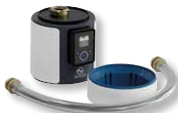
DITECH Anschlussmodul Plus Art.-Nr. DT3645

Das DITECH Anschlussmodul Basic DN 20 kann direkt über das Doppelschlauch-System an die DITECH FüllCombi BA angeschlossen werden.