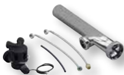
DITECH Anschluss-Set, Siphon Art.-Nr. DT3639