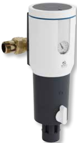
DITECH Hauswasserstation Art.-Nr. DT3650