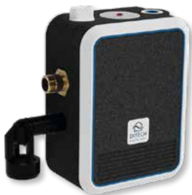
DITECH FüllCombi BA Art.-Nr. DT4157

Die DITECH FüllCombi BA dient dem automatischen Be- und Nachfüllen von Warmwasser-Zentralheizungsanlagen