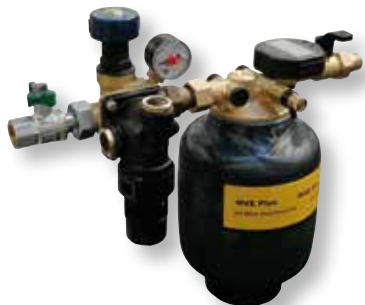
DITECH HVE Plus Kompaktstation Art.-Nr. DT7615

für die Befüllung mit vollentsalztem und ph-Wert stabilisiertem Wasser