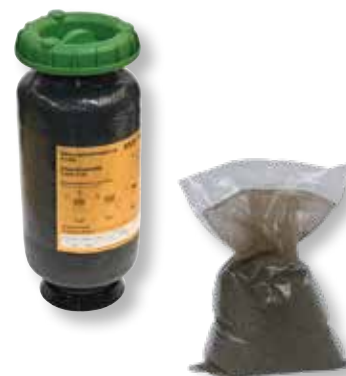
DITECH Kartusche Kombi zur Vollentsalzung mit pH-Wert-Stabilisierung DT760402 2,5 Liter DT760404 4 Liter DT760407 7 Liter DT760414 14 Liter

DITECH Austauschgranulat für Entsalzungskartusche DT76082, 2,5 Liter DT76084, 4 Liter DT76087, 7 Liter