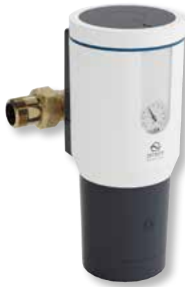
DITECH Wechselfilter mit Druckminderer Art.-Nr. DT3652