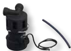
DITECH Anschluss-Set, Abwasser DN 40 Art.-Nr. DT3640