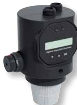
DITECH Mobile Füllstation Art.-Nr. DT7616

für die Befüllung mit vollentsalztem und ph-Wert stabilisiertem Wasser