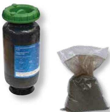
DITECH Kartusche zur Enthärtung DT760202, 2,5 Liter DT760204, 4 Liter DT760207, 7 Liter DT760214, 14 Liter

Heizungsfilter mit Schlamm- und Magnetitabscheider, rückspülbar, mit integrierter automatischer Entlüftung