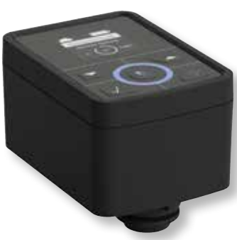
DITECH Rückspülautomatik HWS/RF Art.-Nr. DT3654