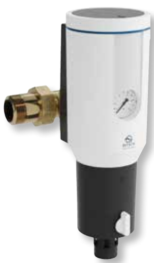
DITECH Hauswasserstation max Art.-Nr. DT3663