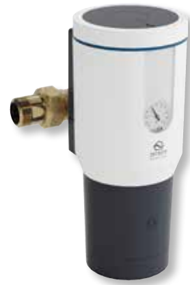
DITECH Wechselfilter Art.-Nr. DT3653