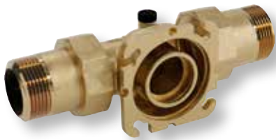
DITECH Schnellmontage-Flansch max DN 40 Art.-Nr. DT366540 DN 50 Art.-Nr. DT366550