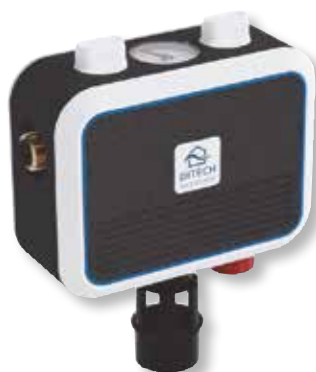
DITECH FüllCombi CA Art.-Nr. DT4158

Die DITECH FüllCombi BA dient dem automatischen Be- und Nachfüllen von Warmwasser-Zentralheizungsanlagen