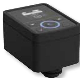
DITECH MultiControl Art.-Nr. DT3646 für Anschlussmodul Plus

Das DITECH Anschlussmodul Plus kann direkt über das Doppelschlauch-System an die DITECH FüllCombi BA angeschlossen werden,